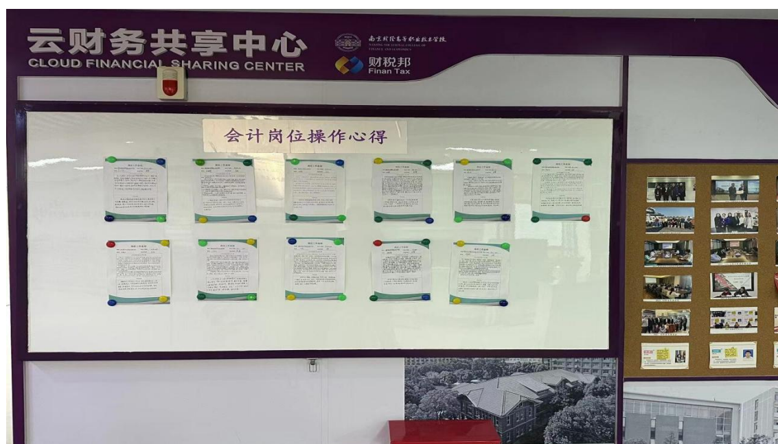
图：学校云财务共享中心宣传栏