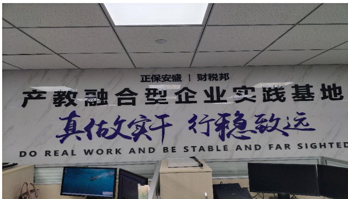
图：学校云财务共享中心文化墙

正保安盛参与了学校的文化墙、宣传栏的设计，将企业文化和价值观融入校园文化建设中，打造真实的现代职场办公环境，帮助学生树立正确的职业价值观和人生观。