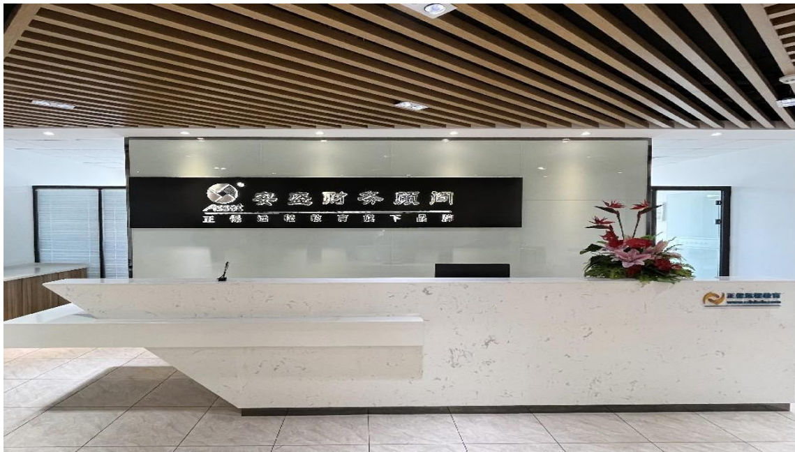
图：江苏正保安盛财务顾问有限公司实景图

江苏正保安盛财务顾问有限公司（原南京欣安盛财务顾问有限公司）是一家拥有多家分支机构的专业财务咨询公司。自 2002 年成立以来，长期致力于为各种类型企业提供会计服务、税收策划及管理咨询等服务，在江苏地区具有较高的行业知名度和专业口碑。公司拥有一支百余人的财务专家团队，不仅为企业提供了良好的财税服务，更将培养现代化企业财务核算人员、财务管理人员作为企业的发展目标。