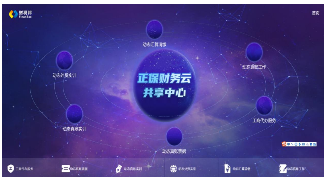
图：正保财务云共享中心教学平台