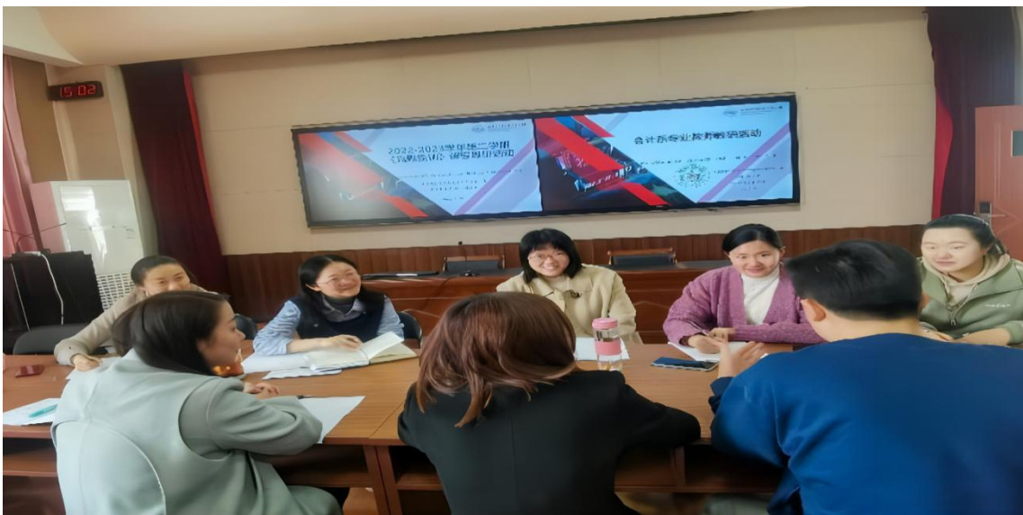
图：会计系开展真账实训教学研讨会照片

金主任对于在真账实训课程中学生们表现出的空前的学习积极性表示肯定，并高度赞扬公司真账实训课程给学生们带来的实操技能，大大缩短了学校理论与职场实务的距离。大家在会议中对下一步教学计划进行了探讨，希望通过财务云共享中心课程的学习，学生的实务技能能够进一步提升，不仅知道账务处理结果，还要清楚账务处理的原理。